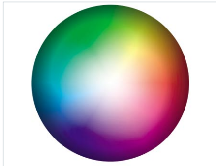
Am Bildschirm gilt die Farbanordnung und das Spektrum des additiven Farbkreises aus den Grundfarben Rot, Grün und Blau (RGB).

Je nach verwendetem Schrifttyp (Times, Arial, Verdana), der Plattform übergreifend auf den gängigsten Betriebssystemen (Windows, Macintosh, Linux) zur Verfügung steht, ist die Angabe einer Pixelgröße vorteilhaft. Pixel sind immer gleich groß, Punktgrößen verhalten sich durchaus anders auf den genannten Betriebssystemen. Damit schließen Sie von vornherein aus, dass ihr Textlayout durch nicht gewollte Textformatierung bei dem einen oder anderen Besucher unlesbar wird. Umfangreichere Texte bieten Sie besser er-