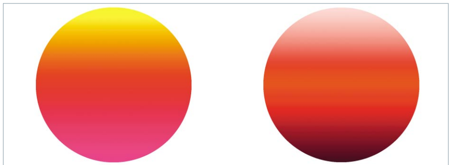
Harmonie: Benachbarte Farben des Farbkreises und ein und dieselbe Farbe in verschiedenen Sättigungsstufen wirken harmonisch.